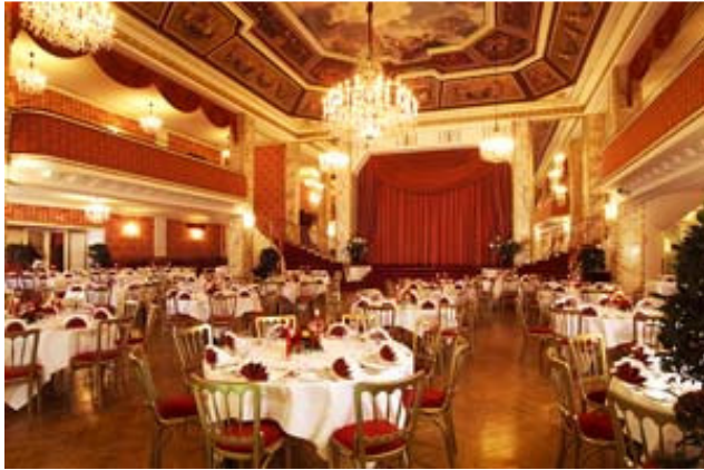
Der Ballsaal im Parkhotel Schönbrunn